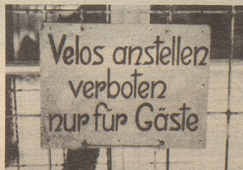
Dieses seltsame Plakat sah ich am Hause einer Confiserie in St. Moritz. E. St., Basel