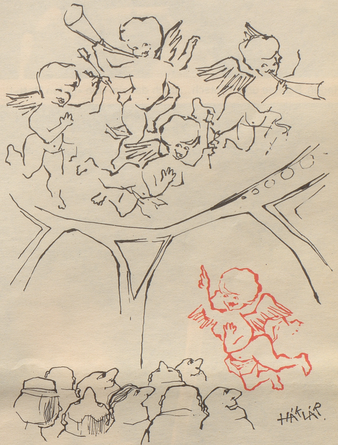
Stilgemäße Fremdenführung in Wien