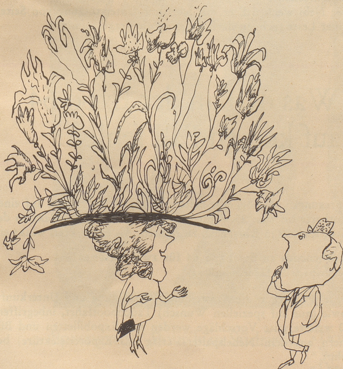
« Alles selbst gepflanzt! »