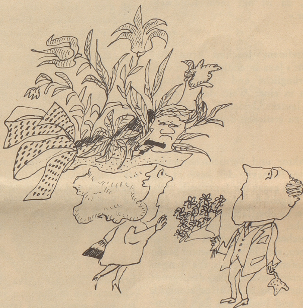
« Mein Mann ist eifersüchtig! »