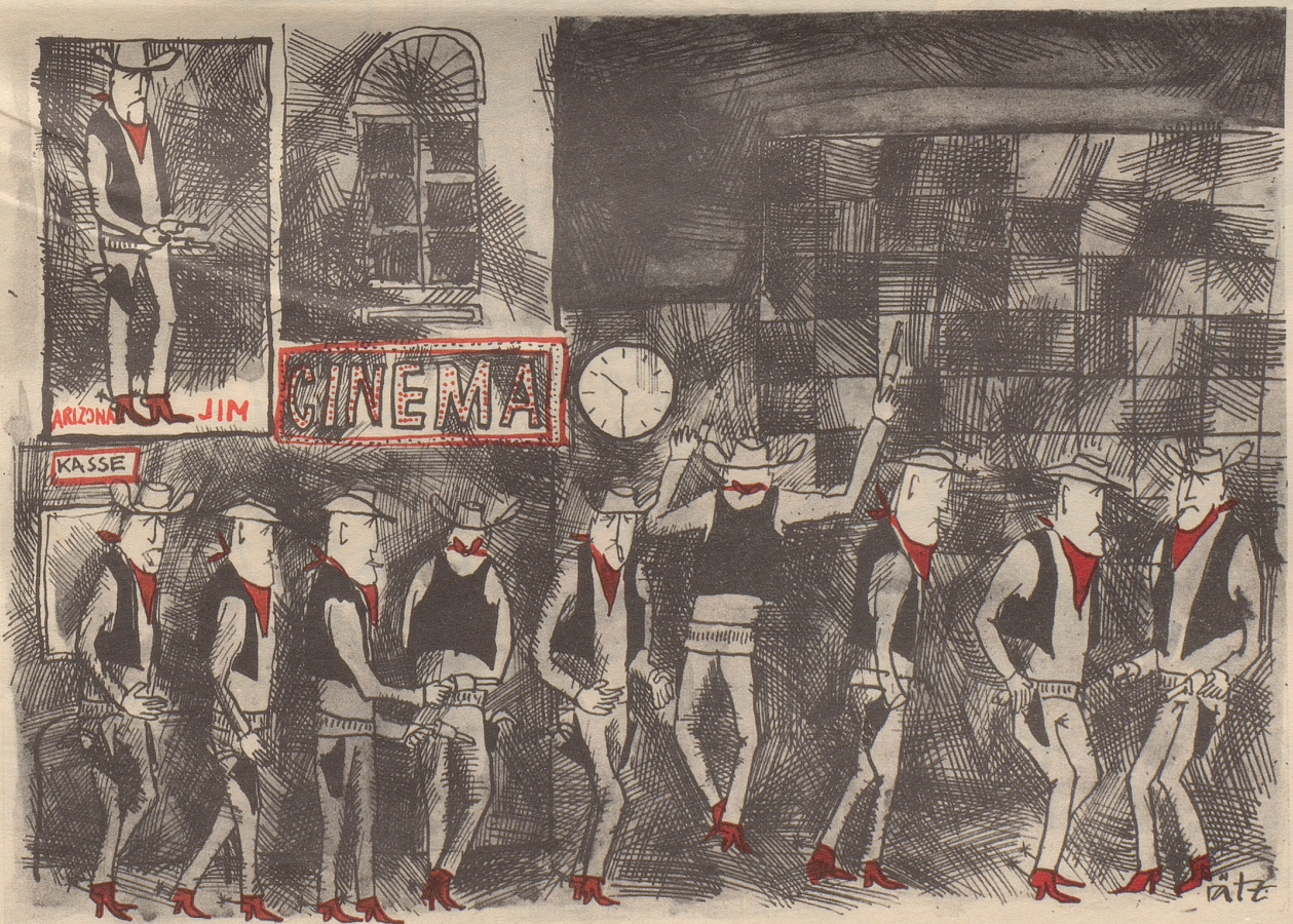
nach der Vorstellung.