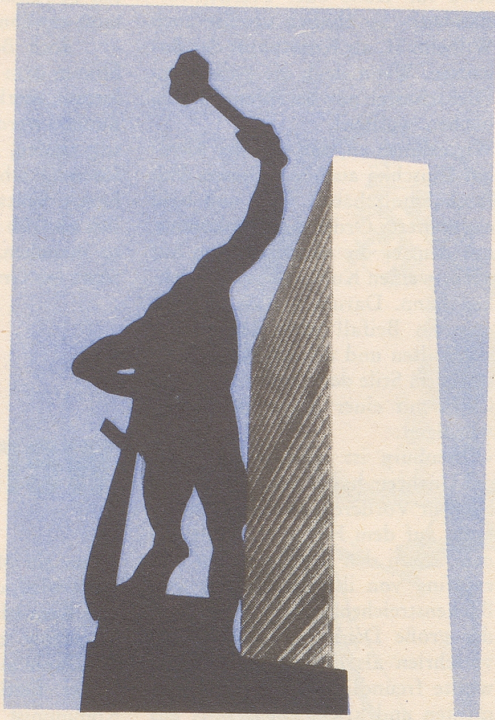
Vor dem UNO-Gebäude in New York wurde diese Steinplastik als Geschenk der Sowjetunion aufgestellt.