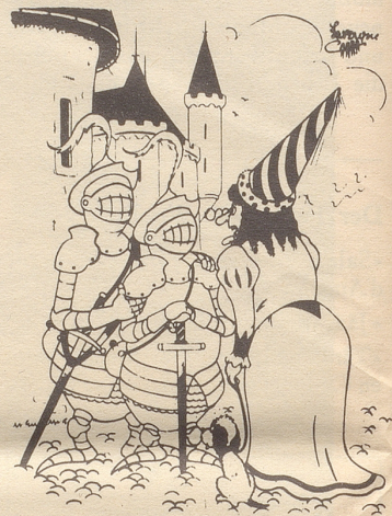
«Frau Gräfin, dies ist mein Sohn.» «Ei, welche Ähnlichkeit!»

700 000 zusätzliche Kilowatt wurden in der Nacht auf Mittwoch, 25. September, konsumiert, während welcher die Engländer den Denning-Report verschlangen. Das will aber nicht heißen, daß dadurch mehr Licht in diese Affäre gekommen sei.