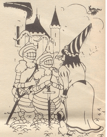
«Frau Gräfin, dies ist mein Sohn.» «Ei, welche Ähnlichkeit!»

700 000 zusätzliche Kilowatt wurden in der Nacht auf Mittwoch, 25. September, konsumiert, während welcher die Engländer den Denning-Report verschlangen. Das will aber nicht heißen, daß dadurch mehr Licht in diese Affäre gekommen sei.