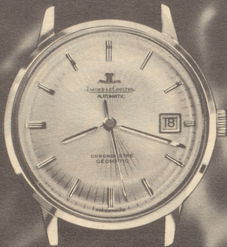
Chronometer Geomatic. Automatisch. Wasserdicht. Stoßgesichert. Antimagnetisch. 23 Rubine. In 18 Kt. Gold ab Fr. 960.- In Edelmetall Fr. 495.-