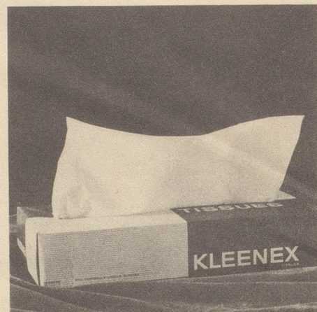
Doch glücklicherweise – hopp – hüpfte Kleenex auf die Bühne, – frisch, weiss und blütenrein.