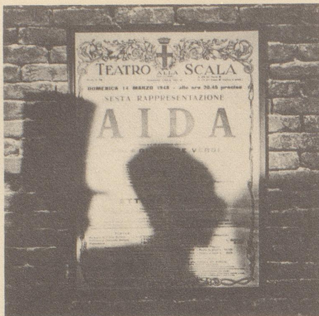
Festliche Premiere in der Oper.