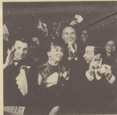
Mit Kleenex ist jeder glücklich und zufrieden!

Und hopp! KLEENEX auch für Sie... weich (für die empfindliche Nase), stark (für den grössten Schnupfen) und - natürlich - blütenrein (denn jedes KLEENEX ist nigelnagelneu).