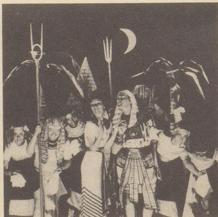
Und es gab genug Kleenex in einer einzigen Schachtel für alle 100 Schauspieler.