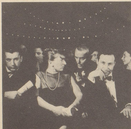
Das Publikum musste deshalb warten und warten, es wurde ganz ungeduldig!