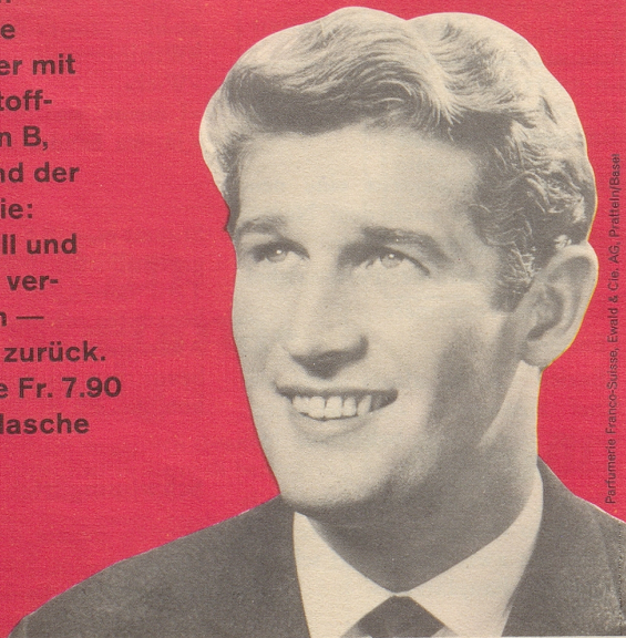
Parfumerie Franco-Suisse, Ewald & Cie. AG, Pratteln/Basel

Das einzige Haarwasser mit den Wirkstoff-Komplexen B, F und H und der FS-Garantie: Haarausfall und Schuppen verschwinden — oder Geld zurück. Kurflasche Fr. 7.90 Standardflasche Fr. 5.90