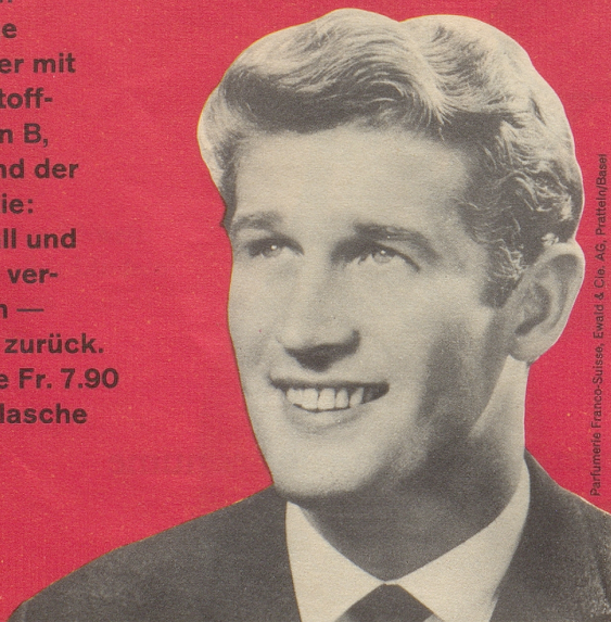
Parlamente Franco-Suisse, Ewald & Cie. AG, Pratteln/Basel

FS-Brennessel-petrol-Konzentrat - ein Spitzenprodukt vom Fachmann empfohlen! Das einzige Haarwasser mit den Wirkstoff-Komplexen B, F und H und der FS-Garantie: Haarausfall und Schuppen verschwinden — oder Geld zurück. Kurflasche Fr. 7.90 Standardflasche Fr. 5.90