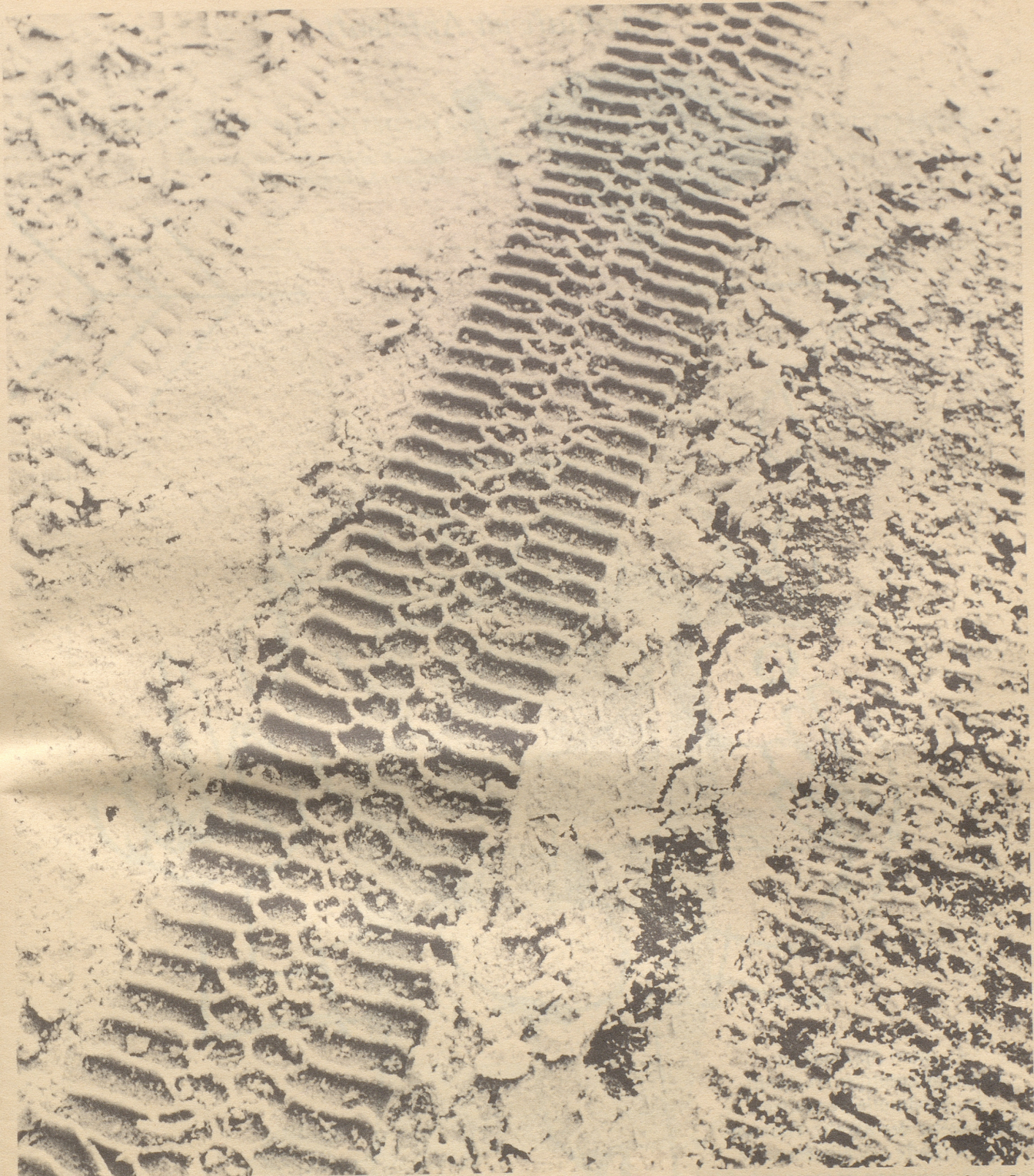
Unretouchierte Aufnahme der Reifenspur eines Firestone Winter Traction