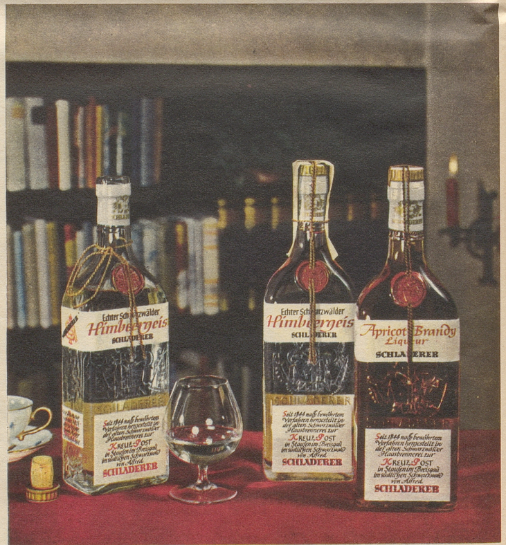
SCHLADERERS echter Schwarzwälder Himmbergeis und Apricot

Schon der Duft verbeisst höchsten Genuss — das vollkommene Aroma übertrifft Ihre Erwartungen!