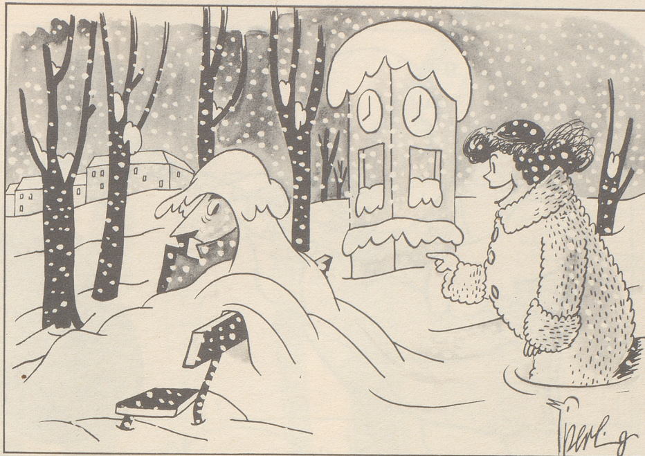
«Guguus! — muesch di nid verschtecke — ha di scho gseh!»