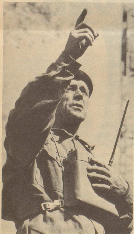
Er muss als Bauführer speditiv und energisch sein. Um den wachsenden Arbeitsdruck zu meistern, trinkt er täglich Ovomaltine.

Ovomaltine stärkt jung und alt, denn Ovomaltine enthält in konzentrierter Form natürliche Aufbaustoffe: Malz (gekeimte Gerste), Frischmilch und Eier mit Zusatz von Hefe, Milcheiweiss, Milchzucker und Kakao. Ovomaltine erfrischt den Geist – belebt den Körper – und mundet herrlich!