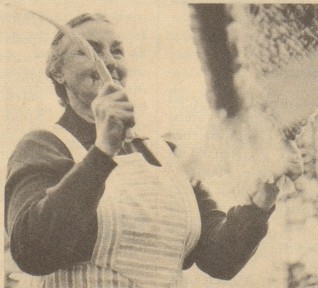
Rasch und beneidenswert energisch besorgt sie ihre Hausarbeit. Ovomaltine ist für sie eine Quelle ihrer Kraft.