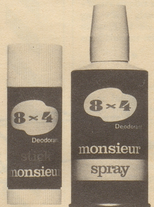
Stick monsieur Fr. 3.60