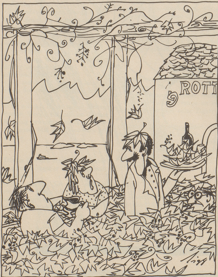
Ausbau des Flugplatzes Magadino

Liaba Härr Bundasroot, dia Sätz uss Iarnam Briaf hend miar khoga guat gfalla. Wells eerlich töönand. Grad ussa, ooni tiplomaatishi Bööga. Warum söll a Bundasroot nitt au zaiga törfa, daß är übar aswas varruckht wordan isch und sich nitt allas bütta loo will. Abitz nohham Motto «Wia du miar, so ii diar.»