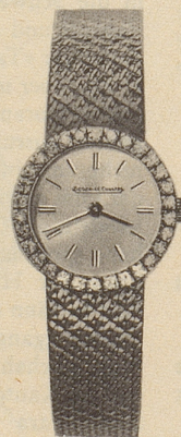
14027 30 Brillanten 18 Kt. Weissgold Fr. 3875.-

* Anlässlich der Landesausstellung 1964 veranstaltete die Schweiz. Uhrenindustrie einen Wettbewerb. Das oben abgebildete Savonnett-Modell aus Platin mit 56 Brillanten und 53 Saphiren erhielt den Ehrenpreis in der Kategorie Brillantuhren. Es ist die kleinste Uhr der Welt. Ihr Werk wiegt mit Zifferblatt und Zeigern nur 1,02 Gramm, doch ist es vierhundertmal sein Gewicht in reinem Gold wert. Einige wenige Exemplare sind von Jaeger-LeCoultre für den Verkauf freigegeben worden. Preis ca. Fr. 20 400.-