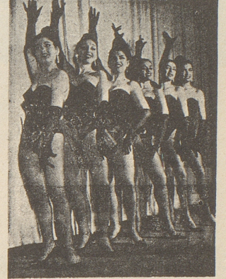
Cabaret Cacadou Lucerne

Das Brockenhaus hat immer Platz für deinen alten Grümpelschatz!