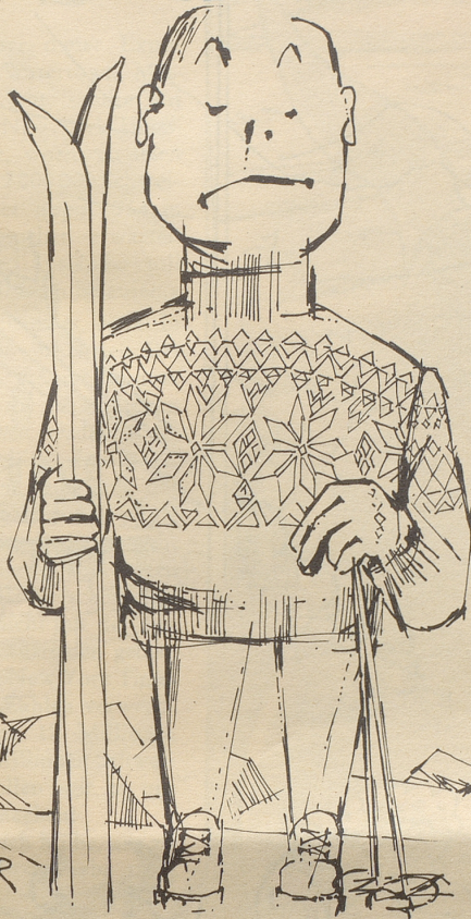
Eine neue Vogelart: Der Innsbrucker Star