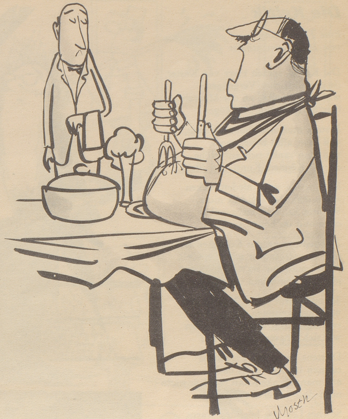
«Sie Garçon — a dem Bifftegg häts ja nüüt als Fett!»

Das ist das Erfreuliche an unserer Zeit: Zu sein, genügt nicht mehr. Dr. med. Politicus