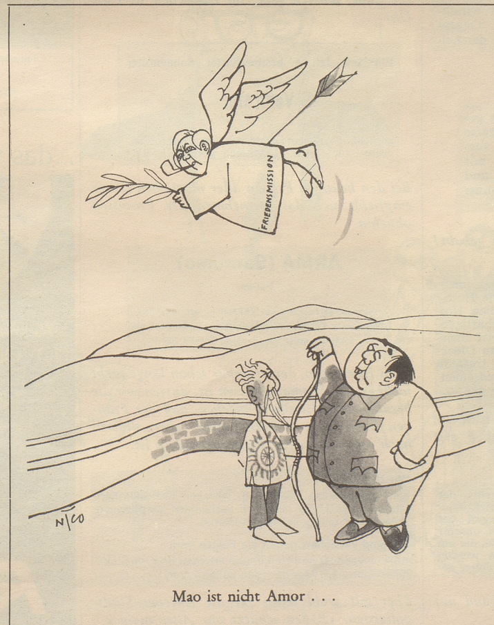
Mao ist nicht Amor ...

Der Bundesrat verlangt einen Kredit von 15 Millionen zum Ausbau der Eidgenössischen Turn- und Sportschule Magglingen. Unsere Regierung tut gut daran, den Leistungssport zu fördern. Meldungen über Schweizer Sporterfolge neh-