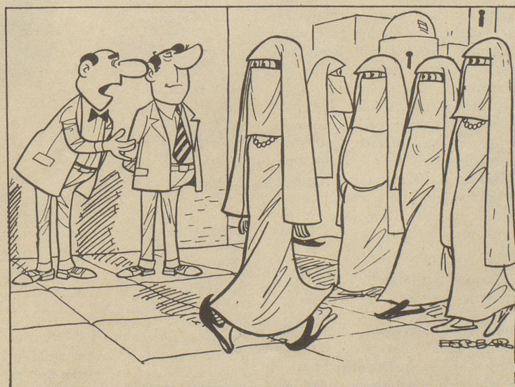
« Und Sie wollen hier tatsächlich eine Fabrik für Lippenstifte eröffnen? »

Soeben las ich in der Zeitung einen Artikel über den Gedenktag der Dürrenäsch-Katastrophe, und da kam mir wieder in den Sinn, worüber ich mich vor einigen Wochen so sehr empört hatte: Nach einem Verwandtenbesuch in Teufenthal führte mich mein Weg gezwungenermaßen durch Dürrenäsch. Obschon ich mir fest vorgenommen hatte, nicht am Gedenkstein vorbeizufahren, – ich wußte nicht, daß er sich direkt an der Hauptstraße befindet – war es mir unmöglich, die Unglücksstätte zu übersehen. Es hatte nämlich davor einen großen, gut ausgebauten, frisch asphaltierten Parkplatz mit einem einladenden, weithin leuchtenden weißen P auf blauem Grund!! Unsere Nachbarin meinte dazu, es fehle nur noch ein Restaurant, damit die Schaulustigen nach ihrem Sensationshunger auch den Durst stillen könnten. Anne-Bäbi