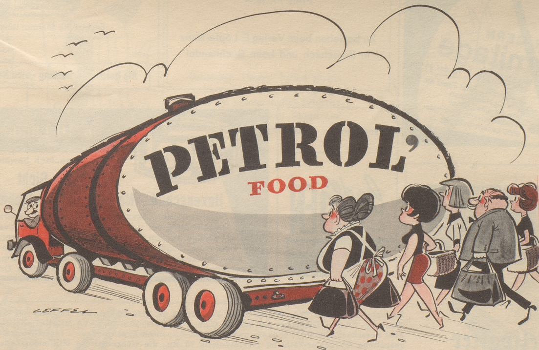
Ein französischer Forscher plant, aus den im Rohöl enthaltenen Eiweißstoffen billige, nach Fleisch oder Fisch schmeckende Nahrungsmittel herzustellen.

«Ganz unter uns, mon cher Couve de Murville: Hat eigentlich etwas herausgeschaut?»