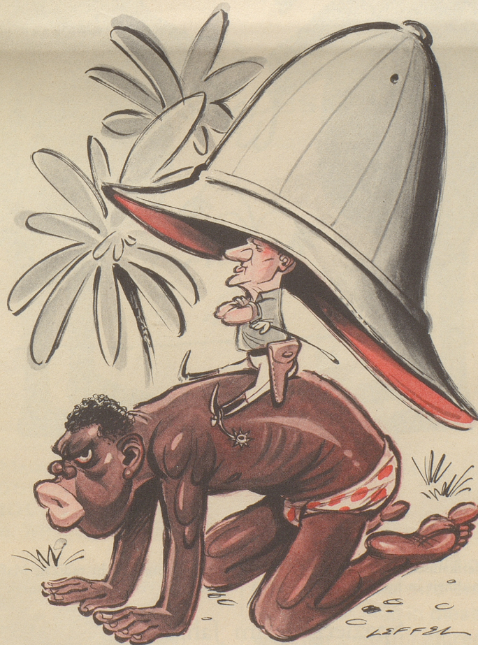
Seine Majestät I(w)an der Schreckliche von Rhodesien

Eine gegen den portugiesischen Diktator Salazar gerichtete Fernseh-sendung von Dr. Hugo Loetscher durfte nicht ausgestrahlt werden. Man habe zwar einen kritischen Bericht erwartet, sagten die Fernsehgewaltigen, aber eine Kritik, wie sie von Dr. Loetscher formuliert werde, dürfe man nicht senden. Nachdem bei uns der Baubeschluß aufgehoben ist, muß auch die Kritik wieder mehr denn je «aufbauend» sein.