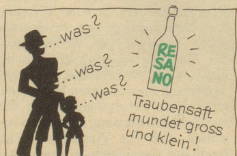
Zu beziehen durch Mineralwasserdepots