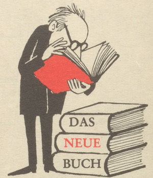
«Die schönsten Städte der Schweiz»

«Aha», resigniert der Kunde ärgerlich, «do isch es also wie bi de Woonige: di beschte Sache gönd immer under de Hand ewägg.» BD