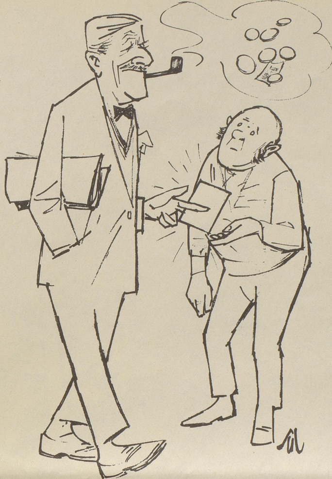
Gegner der Trinkgeld-Gewohnheiten in England haben ein Kärtchen mit Dankesworten herausgegeben, das an Stelle eines Geldbetrages überreicht werden soll.

Mein Traum wäre es, Bertons Vertrauter zu werden. Aber ich habe Angst, daß er mich verachtet, weil ich klein bin.