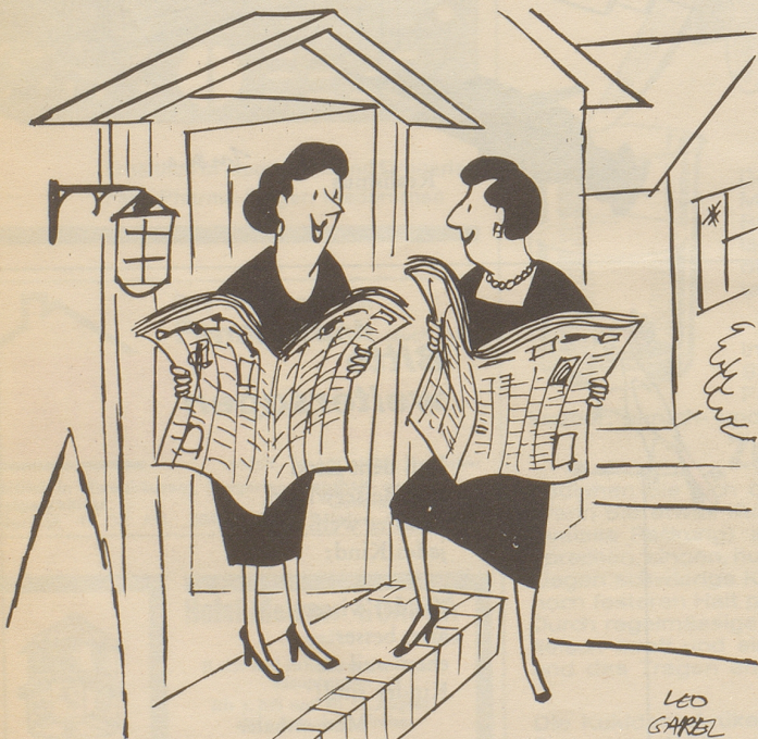
«Da muß irgendwo ein toller Ausverkauf sein — Mein Mann hat auch die Seite 9 herausgerissen!»