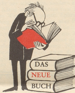
«Q. N. wußte Bescheid»

Jüngst machte die amtliche Beschlagnehmung von Akten von sich reden, von Akten, die von einem eben verstorbenen Journalisten und ehemaligen schweizerischen Nachrichtenmann stammen und sich im Besitze des Publizisten Kurt Emmenegger befanden, der seinerseits jedoch schon im vergangenen Jahr nicht nur Teile dieser Akten in einer Tageszeitung, sondern die Artikelfolge in Buchform veröffentlicht hat: im 134seitigen Buche