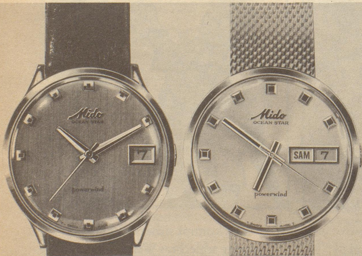
25057 Ocean Star Datometer Stahl Fr. 298.- Goldplaqué Fr. 360.- 5069-MI Ocean Star Datoday zeigt Wochentag und Datum Stahl Fr. 385.- Goldplaqué Fr. 455.-