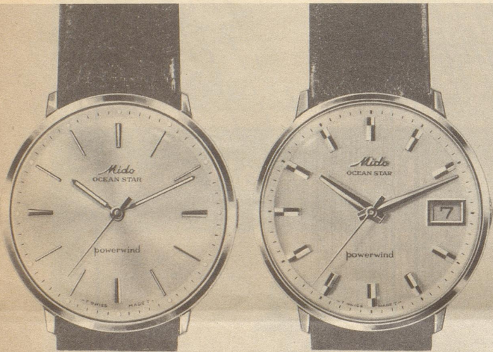
15001 Ocean Star Stahl Fr. 262.- Goldplaqué Fr. 298.- Mit Kalender Fr. 282.-/345.- 55007 Ocean Star Datometer Stahl Fr. 298.- Goldplaqué Fr. 360.- 18 Kt. Gold Chronometer Fr. 745.-