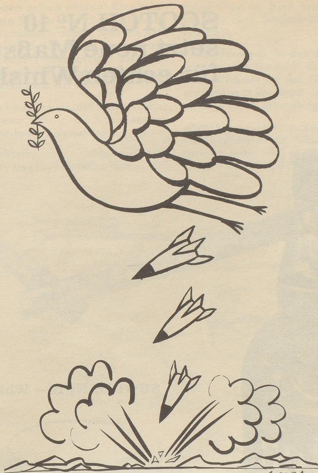
Aus dem Arsenal des Krieges: Die Mehrzweck-Taube