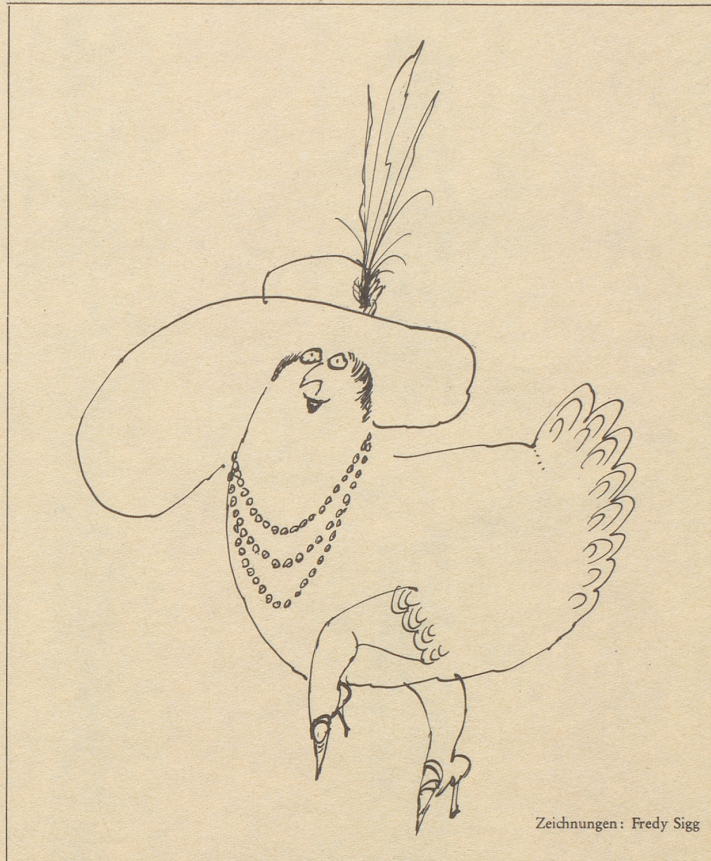
Zeichnungen: Fredy Sigg