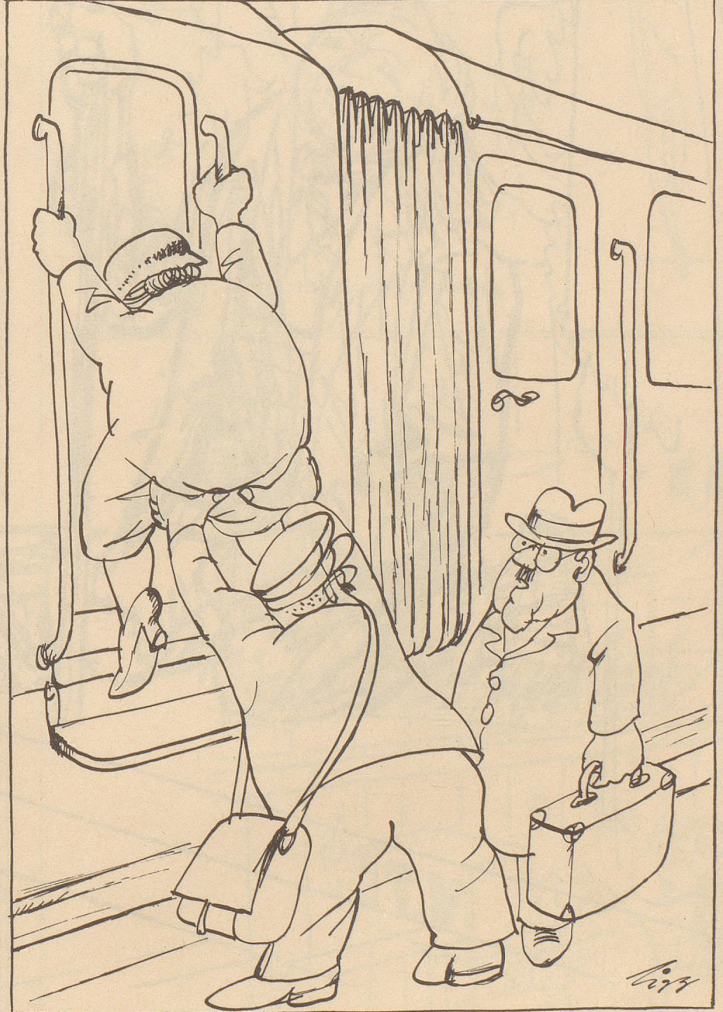
Auf gewissen Stationen erfordert das Besteigen eines Eisenbahnwagens akrobatische Fähigkeiten.

« Hoffentlich wäred d Trittbrätter nöd au na erhöht! »