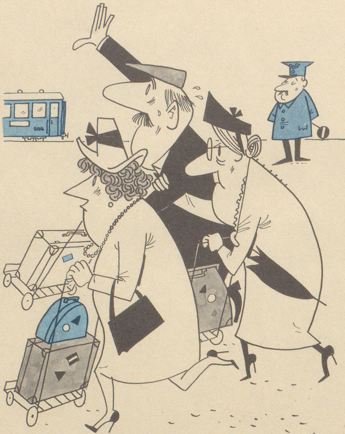
Zeichnung: W. Büchi

Die SBB ersetzen Dienstmänner durch Selbstbedienungs-Stoßkarren.