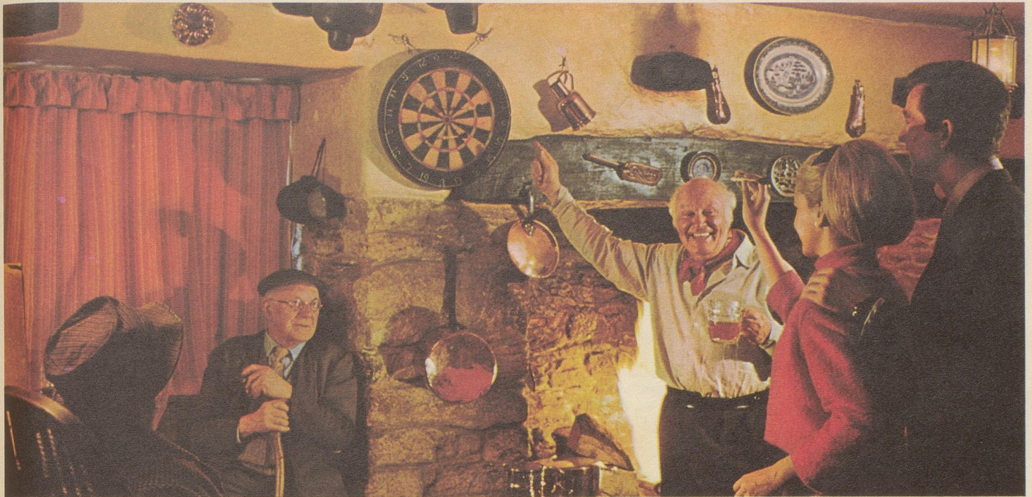
Wirtshaus in Torbryan, Devon.