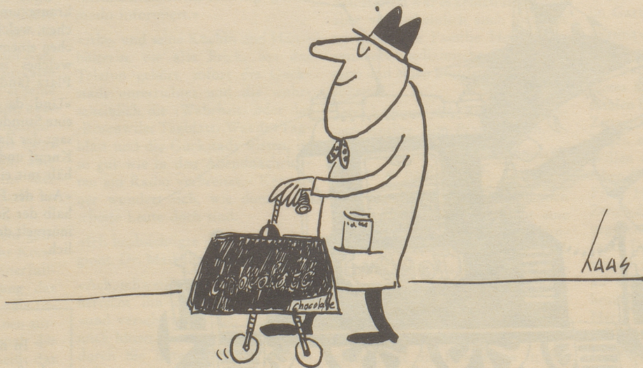
Der Traum des Handelsreisenden