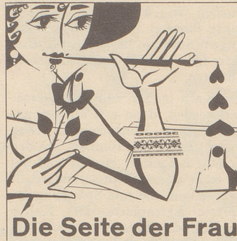
Die Seite der Frau

Auf einmal hörten wir eine aufgeregte Stimme, die nach einem Arzt rief. Ich stand auf, öffnete die Coupétüre: es war der Kondukteur, der einen Arzt suchte. Ich stellte mich ihm als Krankenschwester vor und fragte ihn, was geschehen sei. «Eine Frau stirbt, eine Frau stirbt!» schwafelte er. Ich holte aus meiner Reisetasche meine kleine Reiseapotheke und meine Schwester reichte mir das Gütterli mit Cognac. Der Weg bis zu der Hilfebedürftigen schien mir endlos. Aber endlich gelangten wir zu einem heftig gestikulierenden Menschenknäuel, der da Gang und Coupé versperrte. Nur mit Mühe konnten wir uns durch die Menge hindurchschlängeln; und da sah ich sie, die wohlbeliebte Frau mit dem dunklen Kopftuch. Sie saß zusam-