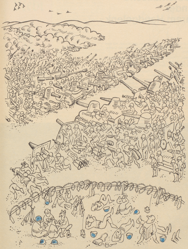
... bringen sich in Sicherheit.