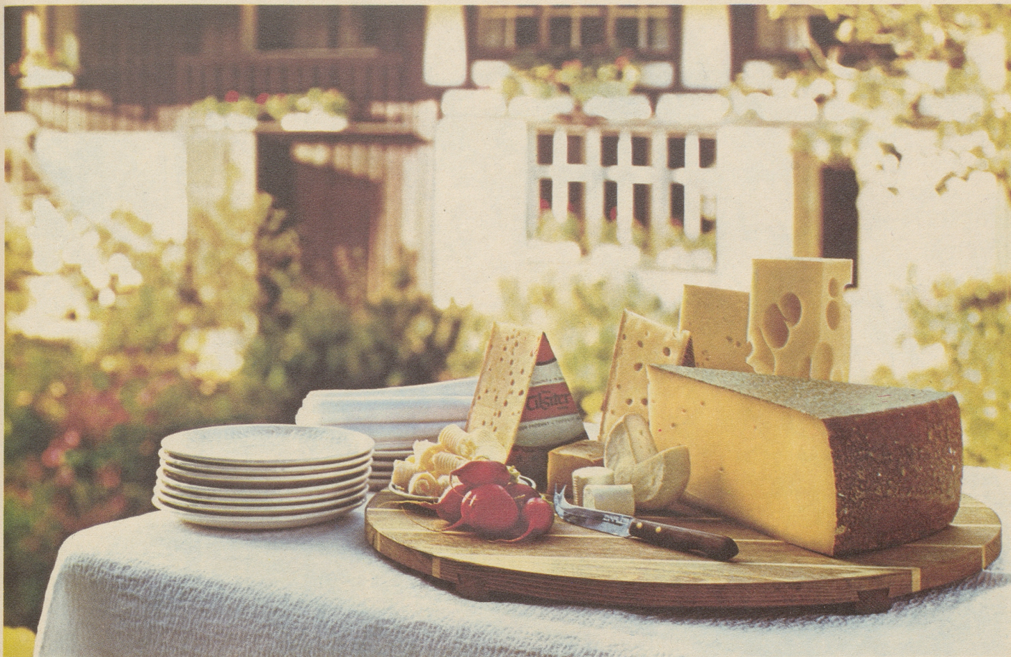
Marken-Tilsiter, Romadour, Petit suisse, Tomme vaudoise, Appenzeller, Greyerzer, Sbrinz, Emmentaler