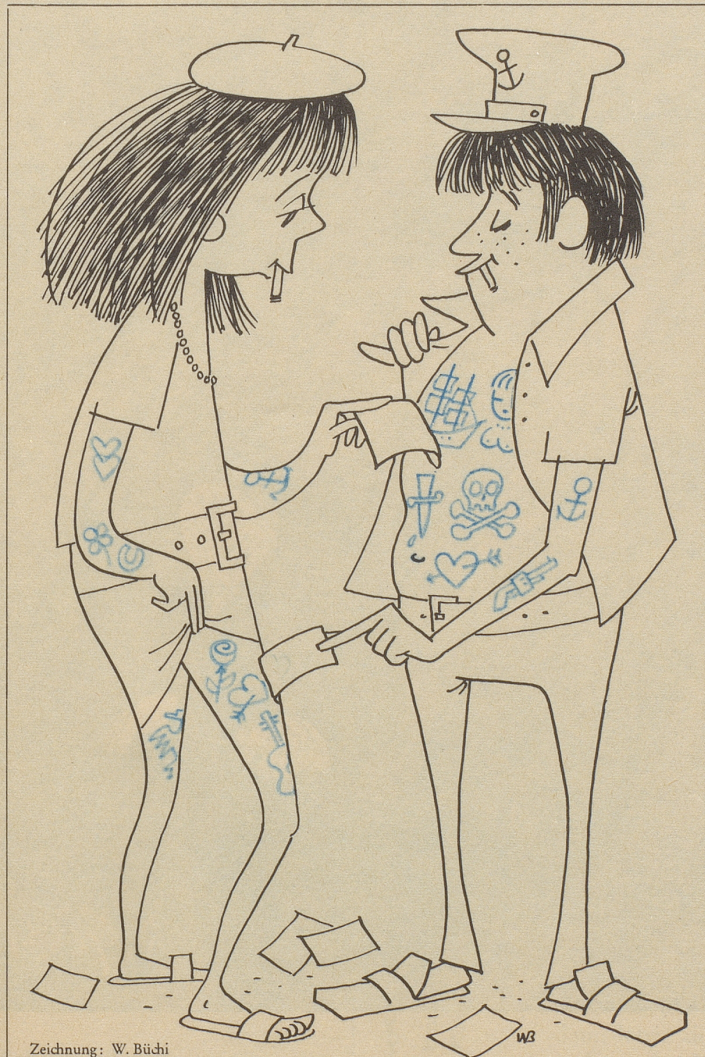
Zeichnung: W. Büchi

«Jimmie», sagt die Lehrerin, «warum wäschst du dir nicht das Ge-