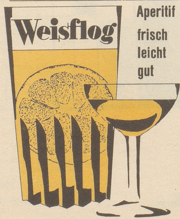
G. Weisflog & Cie. 8048 Zürich-Altstetten

Die Abnützungsscharmützel auf technischer Ebene schleppen sich nun schon seit langen Monaten hin.