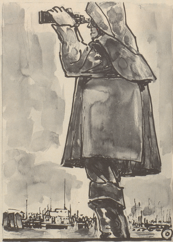
Zeichnung: A. M. Cay

Internationale Ölwehr der Bodenseeländer noch in weiter Ferne.