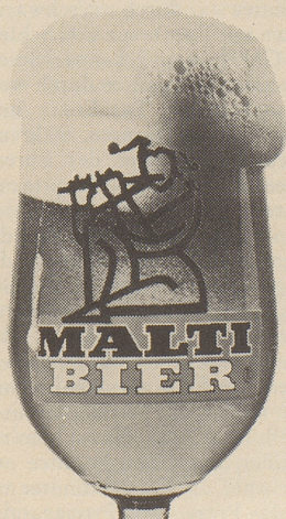
Halt' Di an Malti

MALTI-Brauerei der OVA Affoltern a. Albis Tel. 051 99 55 33