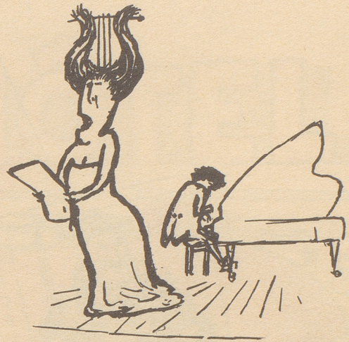
Wagners Musik ist besser als sie tönt. Mark Twain