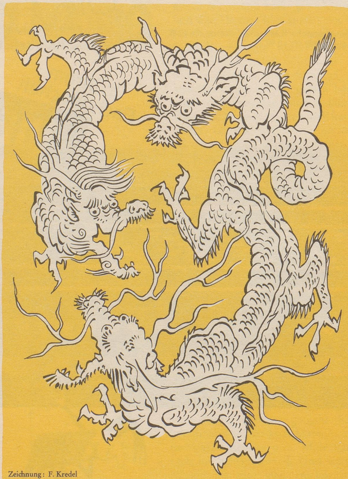
Der chinesische Drachen weiß nicht mehr, wo ihm der Kopf steht.

Der christlichsoziale Parteitag, Kanton Zürich, beauftragte seine Vertreter in Bern, für eine einheitliche Ausgangsuniform aller Grade einzutreten. Der Unterschied zwischen Offizieren und Soldaten soll nur noch in unauffälligen Gradabzeichen bestehen. - Immerhin sollen Embonpoint und Glatze den Spitzen der Armee vorbehalten sein.