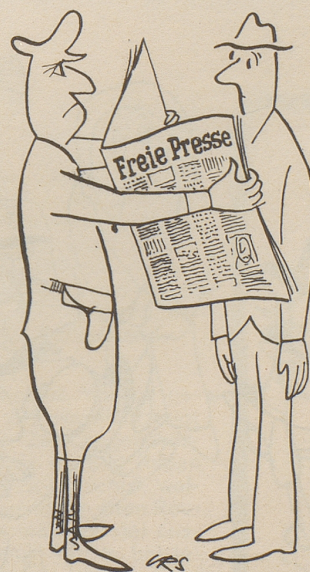
Zeitungsleser in Griechenland

Die öffentliche Meinung ist ein See und man behandelt sie wie eine Suppe. Verrückte Köche stehen vor ihr – der eine wirft Salz hinein, der andere Zucker; ein dritter kommt mit dem Schaumlöffel, die Blasen abzuheben; ein vierter bläst, daß ihn die Backen schmerzen; ein fünfter will sie aufessen; ein sechster sie dem Haushund vorsetzen; ein siebenter will sie in das Spülfaß schütten. Wahrhaftig, die Kinder auf der Gasse werden euch noch auslachen! Ludwig Börne