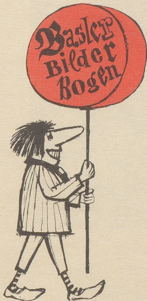
Von Hanns U. Christen

ständiglich eine neue Lichtmaschine!» So ein Ding kostet weit über hundert Franken, und drum sagte ich: «Wirklich?» Er sagte: «Selbstverständlich!» Trotzdem ließ ich sie nicht einbauen, sondern vertraute auf mein Glück. Als ich gelegentlich einmal an einer Tankstelle im Ausland Benzin kaufte, schaute der Tankwart anschließend auf meinen Kilometerzähler und sah, daß das Lämplein brannte, obschon der Motor lief. «Das Lämplein brennt!» sagte er. «Ja, ich weiß, ich brauche eine neue Lichtmaschine!» sagte ich. «Blödsinn», sagte er, «das kommt meistens vom Schalter, wenn er verölt ist.» Er nahm einen kleinen Lappen, tropfte etwas Sprit drauf und putzte den Schalter. Seither brennt das Lämplein nur noch dann, wenn es wirklich brennen muß. Der Tankwart nahm nicht einmal ein Trinkgeld an. Also