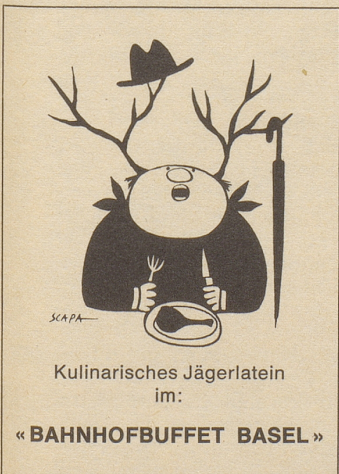
Kulinarisches Jägerlatein im:

Ich muß Ihnen sagen, liebe Automobilisten unter den Lesern: gehen Sie nie zu ausländischen Garagen! Die verstehen einfach nichts von ihrem Fach.