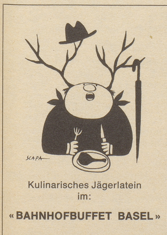
Kulinarisches Jägerlatein im: