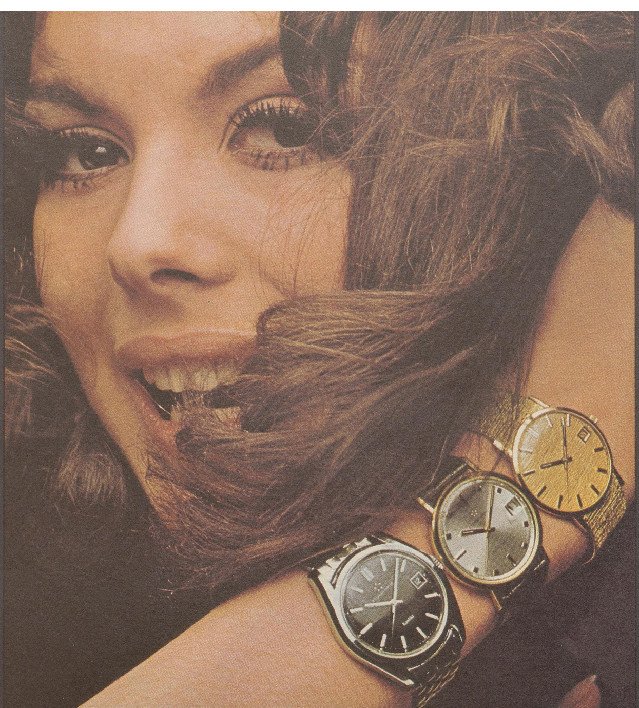
Eterna-Matic 1000 und KonTiki Eterna-Matic Centenaire Eterna-Matic 3000 und Sevenday